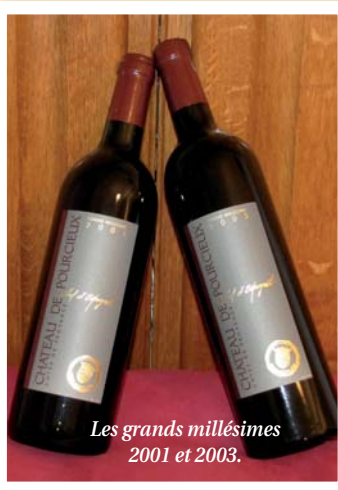
Les grands millésimes 2001 et 2003.

penché parallèlement sur du rouge de garde de large inspiration Syrah, légèrement complétée de Cabernet Sauvignon et/ou Grenache, (bien) élevé jusqu'à 24 mois en barriques. Le résultat est somptueux sur les deux années encore en stock, 2001 et 2003. Tanins fondus, grande intensité et matière en bouche, notes de fruits noirs confiturés, voire de cerises à l'eau de vie, épices, réglisse, vanille au final rappelant le Côte-Rôtie, grande référence Syrah de la Vallée du Rhône, mais avec un petit air de garrigue et de sous-bois du pays de Provence. Pour (à peine) 18,50 et 17,50 euros, ces deux grands millésimes sont de véritables trouvailles pour Noël, le premier, plus fin, pour accompagner du Chevreuil par exemple, le second, plus puissant, de préférence avec une daube de sanglier. Comme tous les goûts sont dans le Pourcieux, le rouge 2007 est un essai réussi vers une plus grande accessibilité, en fruits rouges et tanins arrondis, tandis que le blanc de blanc tourne aussi très rond et, malgré de faibles quantités, joue pleinement son «Rolle» dans la reconnaissance du Château. En outre, il n'y a pas que le rouge qui soigne sa garde puisque Michel d'Espagnet projette une nouvelle étape de modernisation des installations, au cœur des vignes, en attendant de prolonger à nouveau l'histoire avec sa fille et son fils qui écriront à leur tour les prochaines lettres de noblesse... 🍷